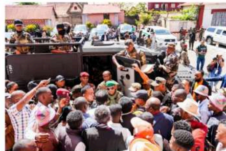
2025 Le renversement du Président La prise du pouvoir par l'armée → L'espoir des jeunes générations