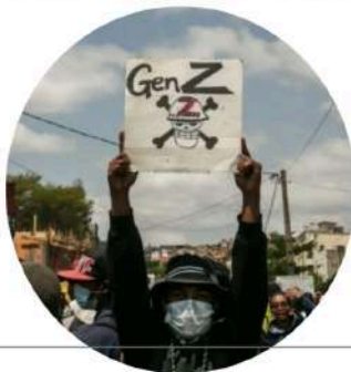
La GEN Z Génération connectée Personnes nées entre 1997 et 2012