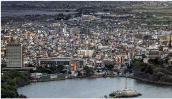
Antananarivo - env. 4 millions d'habitants